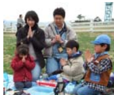
おしょくじまえのいのり